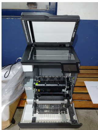
TODOS DA MARCA LEXMARQ E FUNCIONANDO