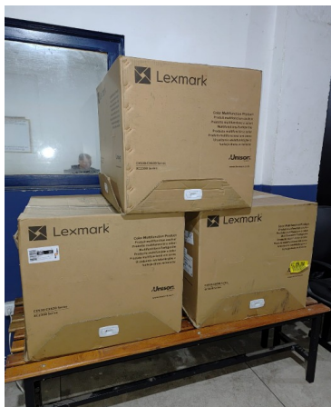
03 IMPRESSORAS NA CAIXA