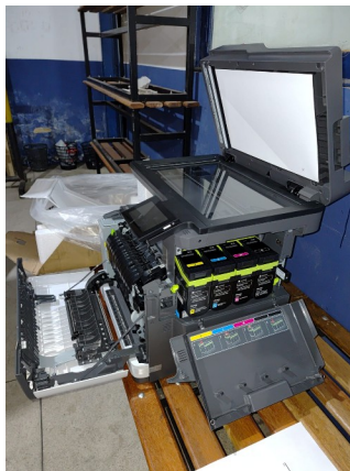
03 IMPRESSORAS NOVAS NA CAIXA (DE PRIMEIRO USO)