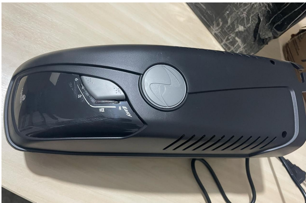
Nobreak Ragtech New Easy Way 1500VA