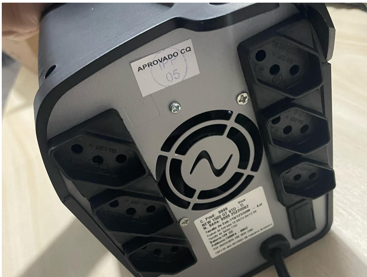
6 tomadas, conforme TR