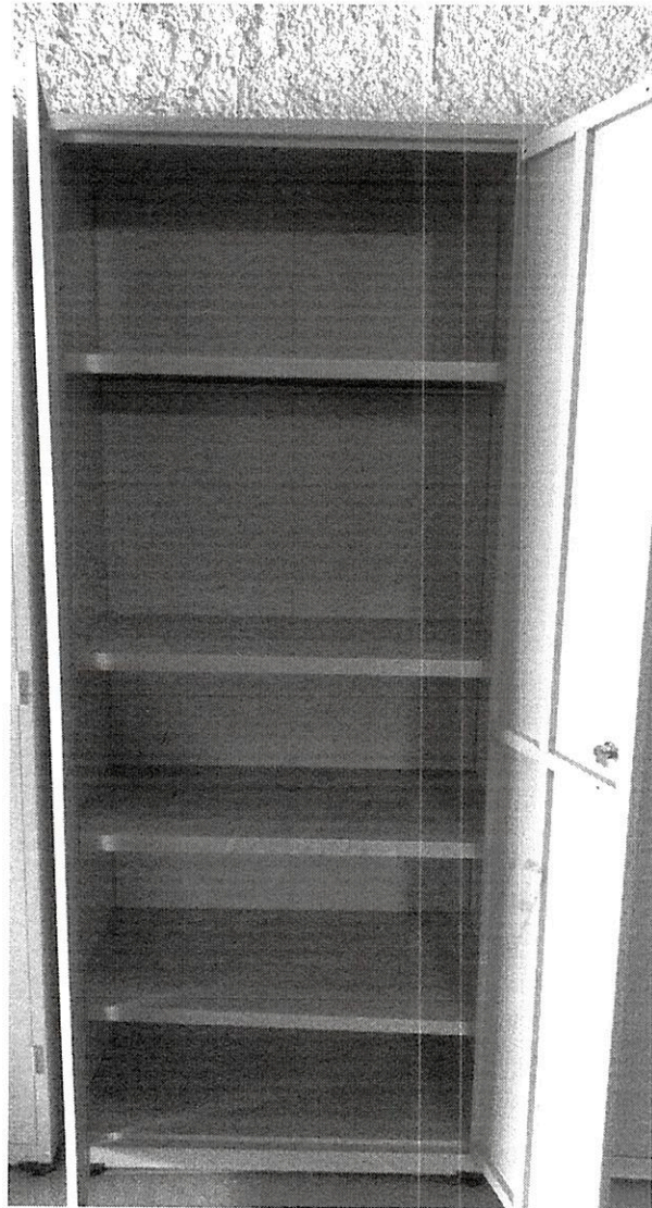
Ilustração 02: Armário Alto em Aço, C/ 02 Portas e 04 Prateleiras (Frente/Aberto)