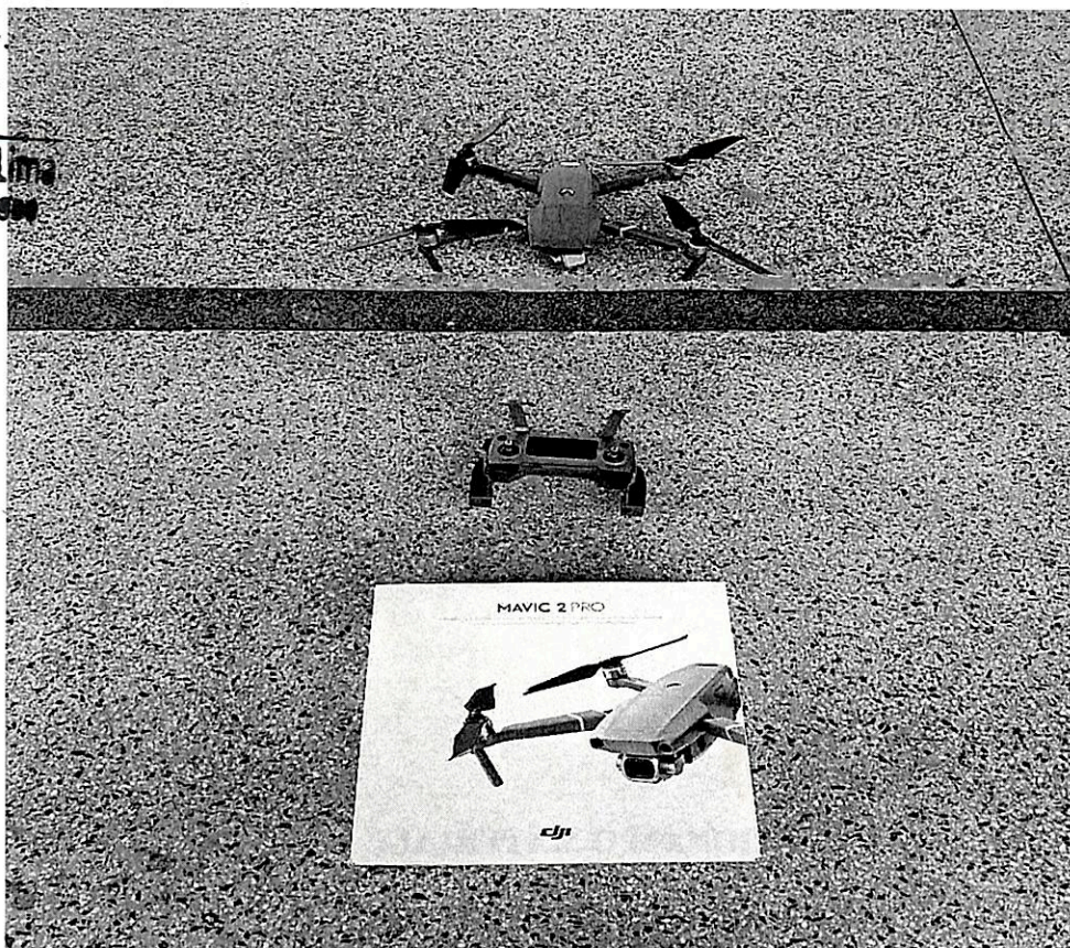
Figura II: AERONAVE DRONE MARCA DJI MODELO MAVIC 2 PRÓ COMBO FLY